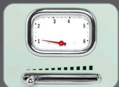
6 Browning temperature setting