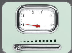
6 Browning temperature setting