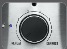
6 Browning temperature setting