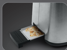
Slide-out crumb tray