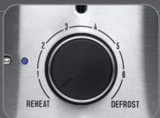
6 Browning temperature setting