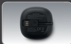
USB charging cable